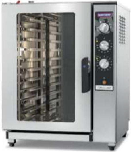
Four d'une puissance > 5 kW