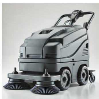
Lustreuse pour sol professionnelle