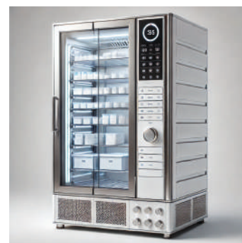
Réfrigération échantillons médicaux