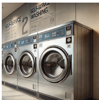
Appareil d'entretien des vêtements avec pompe à chaleur