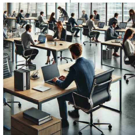
Utilisation cadre professionnel

Les appareils dual-use ne sont pas considérés comme des appareils professionnels, mais comme des appareils ménagers et sont à déclarer au sein d'Ecotrel dans le cadre de la convention d'adhésion pour les appareils ménagers. Pour la mise en place de cette dernière, merci de nous contacter par téléphone au +352 26 098 732 ou par e-mail à business@ecotrel.lu .