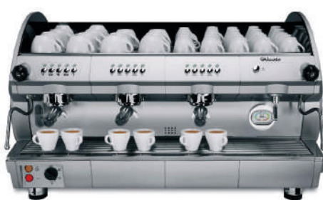
Machine à café professionnelle