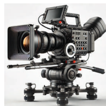
Caméra de plateau professionnelle