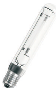
Lampe à vapeur de sodium haute pression