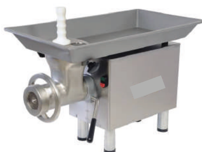
Hachoir à viande professionnel