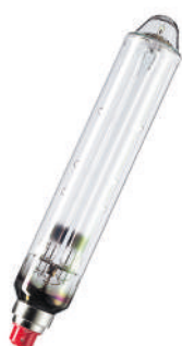
Lampe à vapeur de sodium basse pression