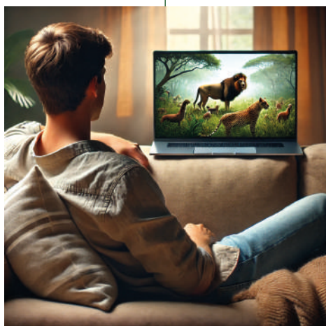
Utilisation cadre domestique