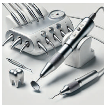
Appareil de soin dentaire