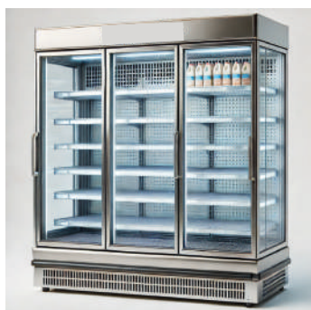
Meuble froid commercial