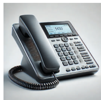
Centrale téléphonique professionnelle